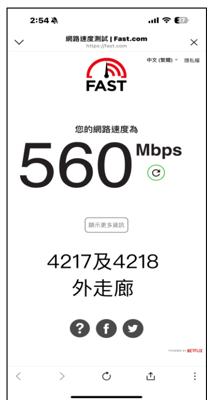
圖 3 昌明樓 4217 及 4218 教室外 走廊網路速度測試圖