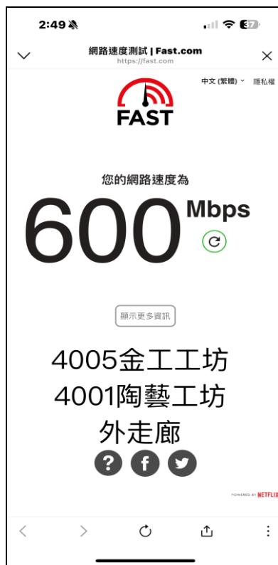
圖 2 昌明樓 4001 及 4005 教室外 走廊網路速度測試圖