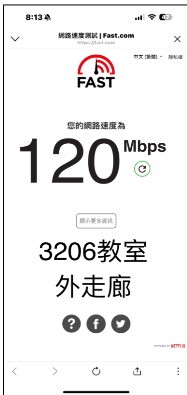
圖 1 中正大樓 3206 教室外走 網路速度測試圖