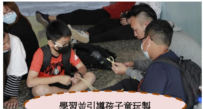
學習並引導孩子童玩製