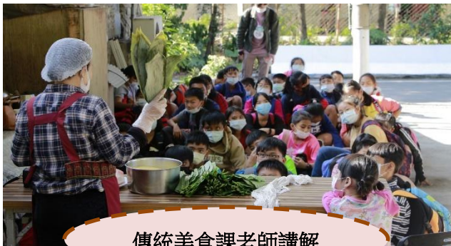
傳統美食課老師講解

城鄉小學的學生成長及環境各異，優劣參半，如何截長補短，透過寒假營隊活動及遠距共學方式，彼此看見並體認生活文化差異，達到相互了解、接納，互相提攜、學習、成長的功效，同時服務學童的大學生隊輔們也可以藉此體認服務的意義，達到從做中學，落實學用合一的教育目的。