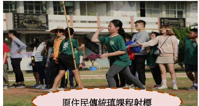
原住民傳統瑣課程射標