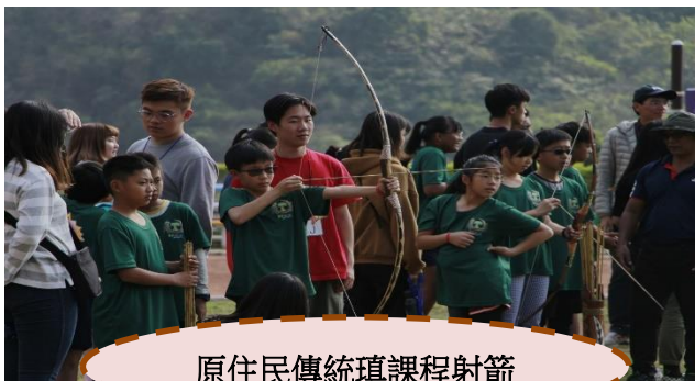
原住民傳統瑣課程射箭