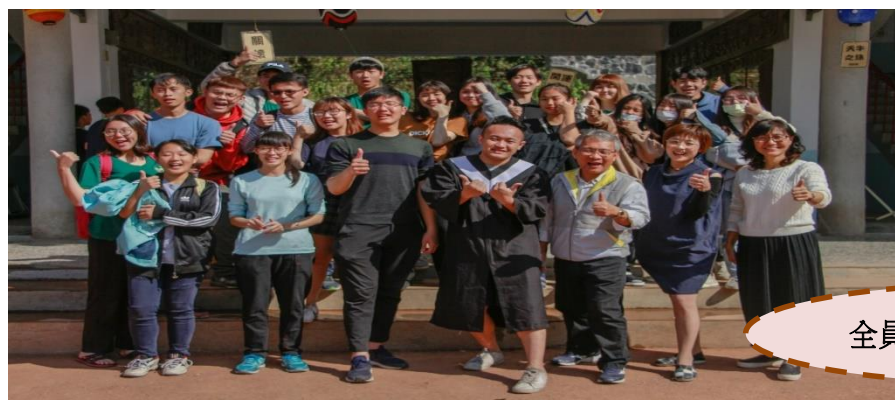
全員與來義國小師長合照