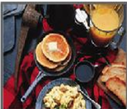
共用食物, 餐具, 杯子或書本