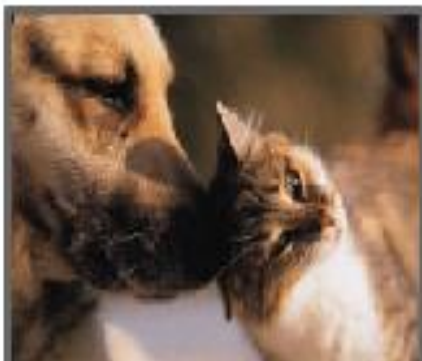
由貓狗或其他動物