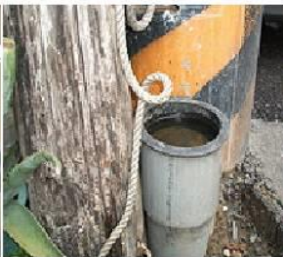
台電地下電纜引上管