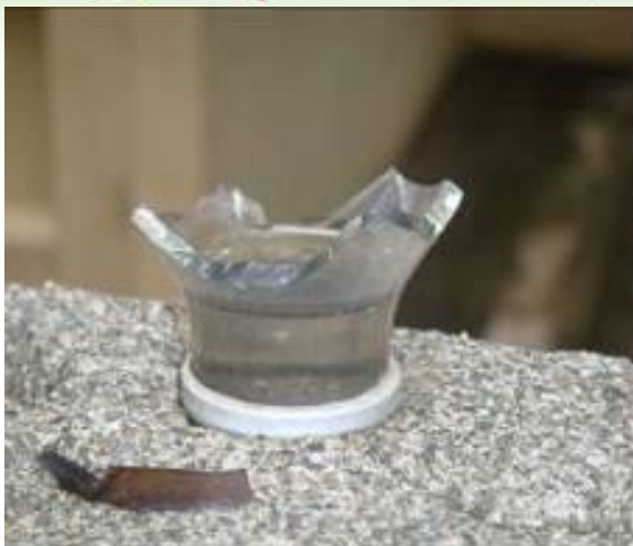
防竊盜圍牆碎玻璃