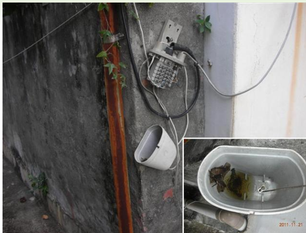
電信 DJ 箱