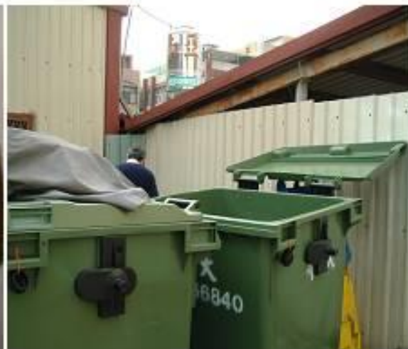
大型塑膠資源回收筒