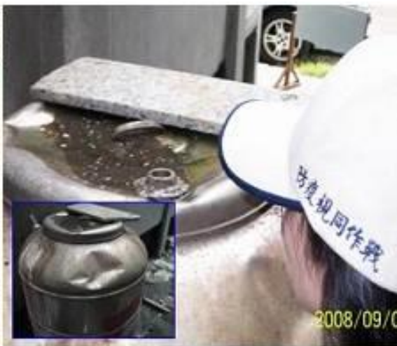
儲水桶鐵蓋凹陷處