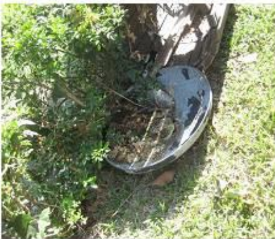
鐵製廢棄垃圾桶蓋