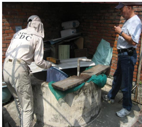
覆蓋細紗網未密合之水井