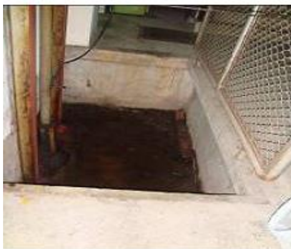
地下室之升降梯孔積水