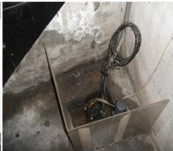
抽水機馬達的陰井